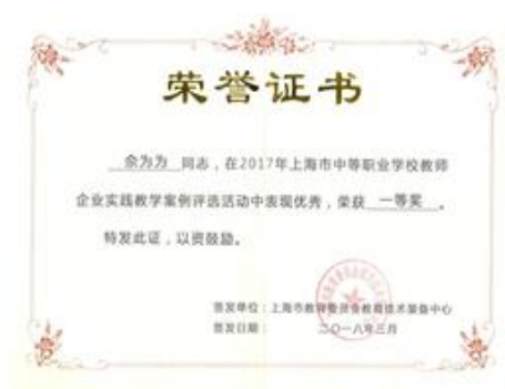
图9 企业实践案例一等奖