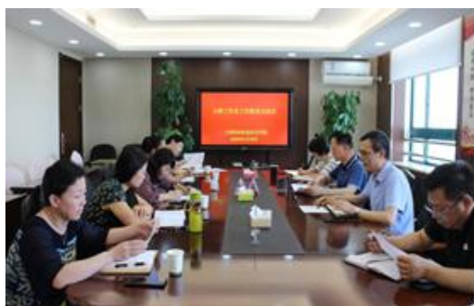
图8 大师工作室总结会

学校大力发掘资源，为教师搭建多元化企业实践平台，增强教师专业实践能力，提升学校师资队伍能力素质和整体教学水平。一是建立大师工作室，聘请了15名校外企业技能大师指导专业建设、技艺传承、科技研发等。二是选派教师至相关校企合作单位进行践习。三是现有实训基地（松江五厍、浦东南汇、奉贤海湾）、乐实农产品销售公司和宠物医院3处供我校教师进行专业实践。2020年，完成松江区高技能人才资助项目“植物科学技术系花艺首席技师工作室”中期评估，风景园林系大师工作室就师资培养、专业建设、技术指导等工作开展情况以及近两年取得成果进行了总结汇报，动科系大师工作室制定了目标规划。2019年，企业践习30人次2149天，宠物医院实践10人次281天，实训基地实践5人次420天。2020年，企业践习14人次1082天，宠物医院实践8人次454天，实训基地实践2人次60天，1人获得上海市企业实践案例评选一等奖。