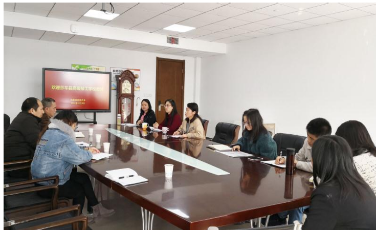
图7 新疆教师与风景园林系教师进行课程交流学习

2019年魏华校长带队一行4人赴莎车职校考察，初步达成双方协作框架。在巩固完善原有项目建设基础上，急新疆喀什地区所需，尽学校所能，重点筹划园林园艺专业建设的对接工作。双方互派教师开展交流学习，内容涉及园林园艺专业的培养方向、课程设置、师资队伍培训学习、实验实训场所建设等。开启远程教育1-2门课程，实现远程授课。信息化建设继续进行。12月6日至2020年1月6日新疆莎车职业技术学校派2名教师来学院园艺园林系进行为期一个月的培训学习。