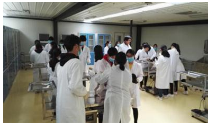
图 11 犬只保定学生分组实训现场