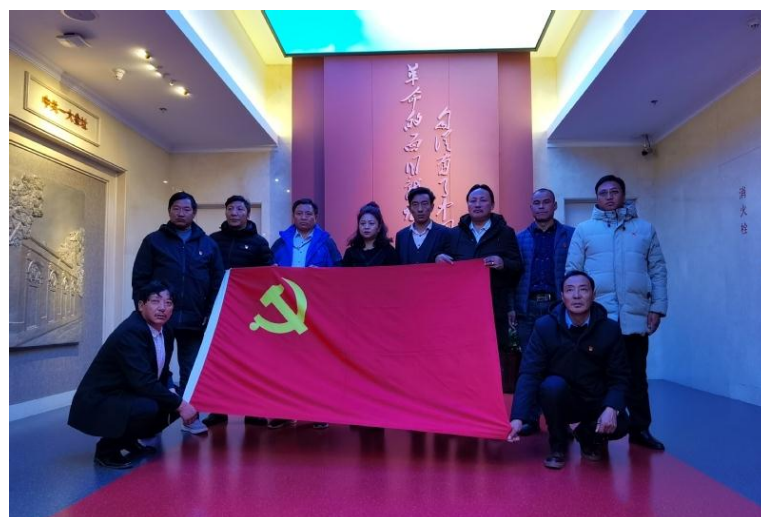
图 6 在上海中共一大会址参观学习