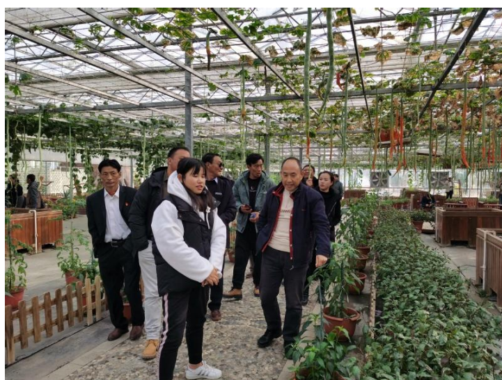
图 5 考察现代农业实训基地

制定科学的教学实施方案，精心选编教材，选定授课专家。培训采取专业知识与现场教学相结合的方式，现场教学选取上海市郊在现代农业、牧业经营管理等方面具有代表性的示范基地开展。由于培训内容实用性强，专家授课深入浅出，参训学员学习积极性非常高涨，即开阔了视野，又掌握了现代农牧业发展新趋势，思考和探索了抓住机遇政策实现贫困地区的脱贫攻坚，共同推进了青海果洛地区产业扶贫和农业援青工作迈上新的台阶。