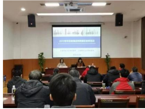
图 4 2019 学年职教集团特聘兼职教师培训