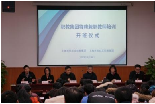
图 3 职教集团特聘兼职教师培训开班仪式

特聘兼职教师是职业教育发展的重要力量，是学校专业教师团队的重要组成部分，在学校专业建设、教育教学、技能竞赛等方面扮演着重要的角色，有着不可或缺的作用。通过对特聘兼职教师开展专家讲座、参观考察、学习交流、撰写小结等活动，较好地提升了兼职教师理论水平和教学能力的总体水平。近年来通过两个职教集团的持续合作，已形成了特聘兼职的培训长效机制，每年的培训项目也越来越向成熟和全面发展，促进了现代职业教育的发展。